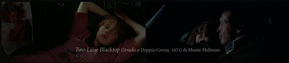
Two-Lane Blacktop ( Strada a Doppia Corsia , 1971) di Monte Hellman