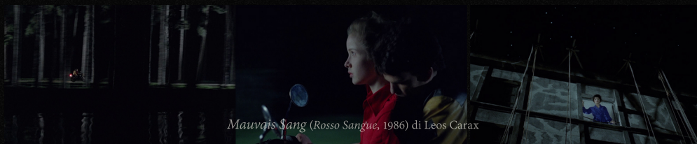
Mauvais Sang ( Rosso Sangue , 1986) di Leos Carax