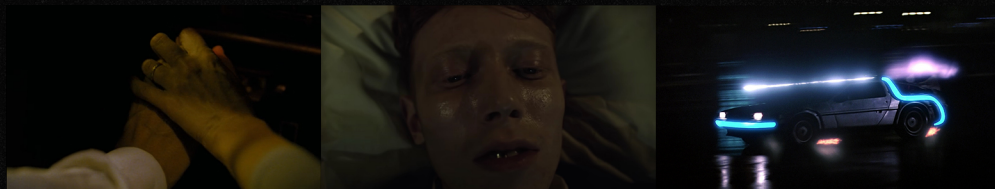
Les Amants du Pont-Neuf ( Gli amanti del Pont-Neuf , 1991) di Leos Carax